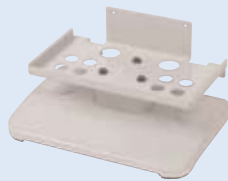
Standfuß optional erhältlich (grau).