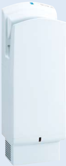
JET TOWEL Farbe Weiß