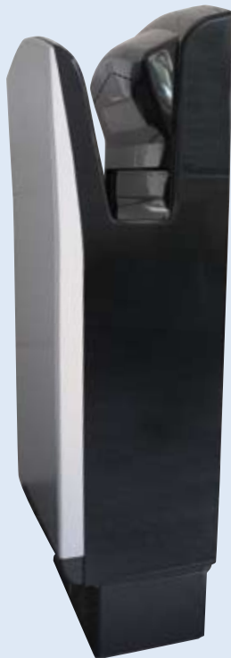
JET TOWEL Farbe Anthrazit/Silbergrau